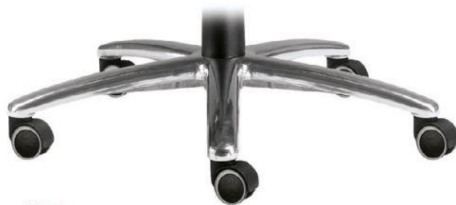
AL7 (Ø 675) Base in alluminio pressofuso lucido